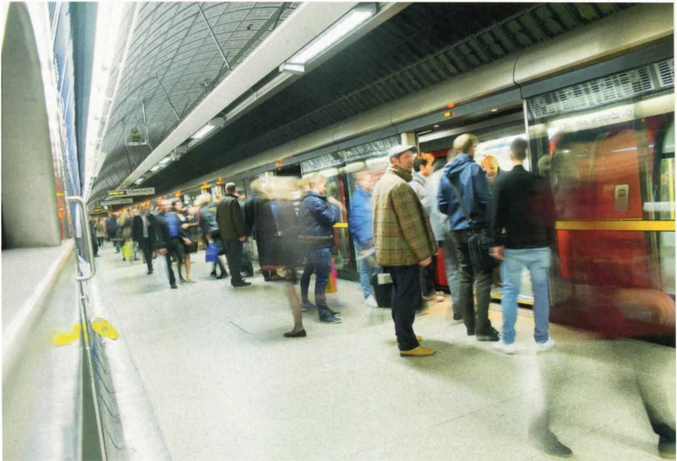
An Bahnsteigen können Fahrgäste zu den Bereichen „gelenkt“ werden, an denen Wagen mit ausreichendem Platzangebot halten werden.

Die verschiedenen für MOBILEguide benötigten Microservices können hierbei je nach Bedarf unabhängig voneinander skaliert werden. Sie sind einzeln testbar und damit auch ausgesprochen robust. Konkret kann man den Datenfluss wie folgt beschreiben: Die Fahrzeuge senden pro Ereignis eine Nachricht an den MQTT-Broker. Ein Ereignis kann zum Beispiel ein Stopp an einer Haltestelle oder ein Zählereignis an einem der türscharfen Zählsensoren sein. Vom MQTT-Broker werden diese Nachrichten kontinuierlich und in Echtzeit abgeholt und in ein Kafka-Topic als Zieladresse übertragen. Die nachfolgenden Services akkumulieren die Einzelereignisse und fassen sie so zusammen, dass sich sowohl absolute als auch (nach einem weiteren Verarbeitungsschritt) relative Belegungszahlen pro Wagen und Haltestelle ergeben.